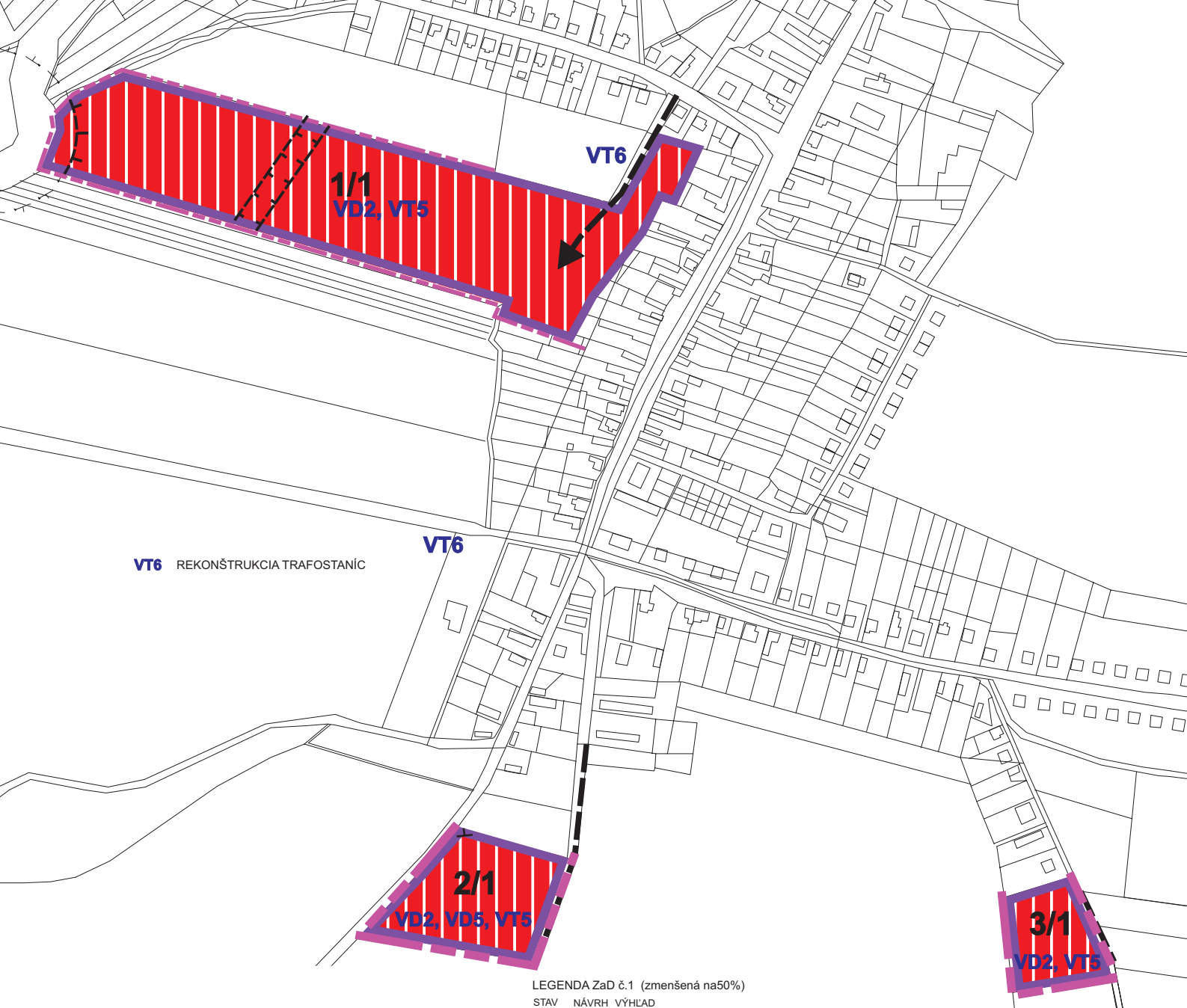
LEGENDA ZaD č.1 (zmenšená na50%)