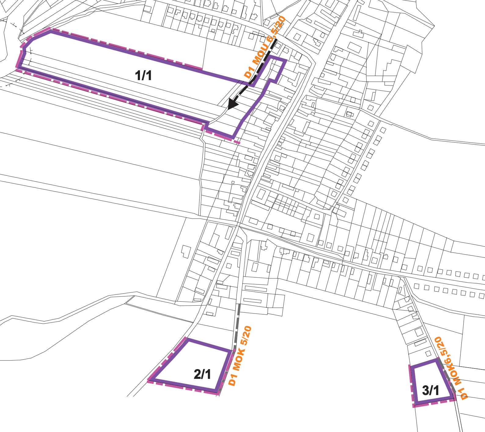
LEGENDA ZaD č.1 (zmenšená na 50%)